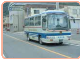
河内あゆピチふれあい号