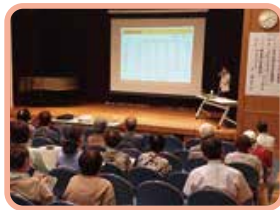
空き家予防啓発講演会の様子