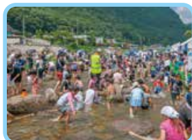
リバーサイドフェスティバル