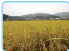
造賀地区の田園風景