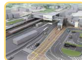
西高屋駅完成予想図

※4 ICT:Information and Communication Technologyの略。情報通信技術のこと。 ※5 地域拠点:各生活圏の居住者の生活を支える、地域の核となる拠点。 ※6 Town&Gown構想:タウン(市)とガウン(大学)が一体となってまちづくりに取り組む構想。自然豊かな東広島市に、大学を中心とした新しい技術を取り入れることで、世界中から多様な企業や人材が集まり、平和で、環境にもやさしい、持続可能なまちをつくることを目指す。