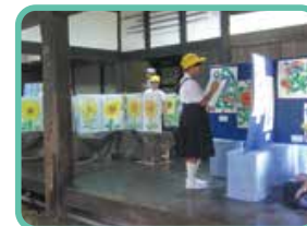
木原家住宅でのチャイルドアート