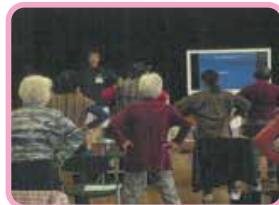
介護予防に取り組む通いの場