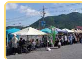
地域住民が運営する産直市